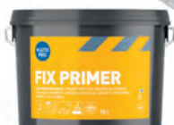
Kiilto Pro Fix Primer nakkedispersioon