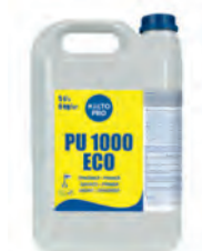
PU 1000 ECO Primer polüuretaankrunt