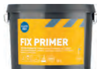
Kiilto Pro Fix Primer nakkedispersioon