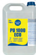
PU 1000 ECO Primer polüüretaankruv