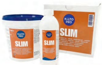
Kiilto Slim 2-komponentne PU parketiliim