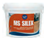
Kiilto MS Silex elastne veevaba parketiliim