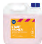
Kiilto Pro Start Primer nakkedispersioon