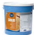
Kiilto Solid vesialusel parketiliim